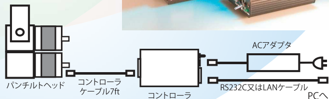
パンチルト雲台システムSPT-E06基本構成